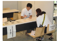
耐震診断申し込み

会場にて 岐阜市木造住宅無料耐震診断 のお申し込みを受け付けいたします。 ご希望の方は 家屋の課税明細書 をご持参ください。 ※ 昭和56年5月31日以前に着工された木造一戸建て住宅が対象です。 ※ ブロック塀など撤去費助成事業およびその他の耐震補助事業の相談も受け付けいたします