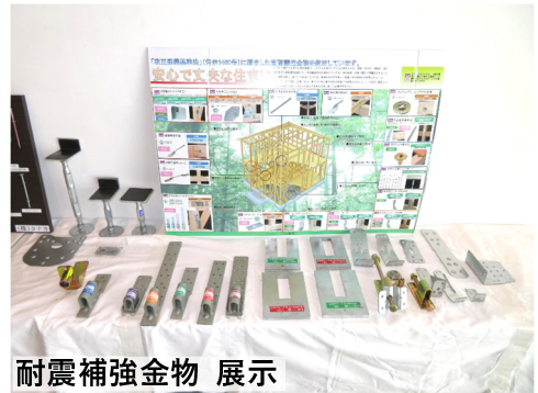
耐震補強金物 展示